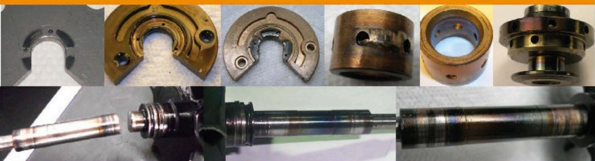
Lack of Lubrication or Oil Degradation / Deficiencia de Lubricación o Aceite Degradado