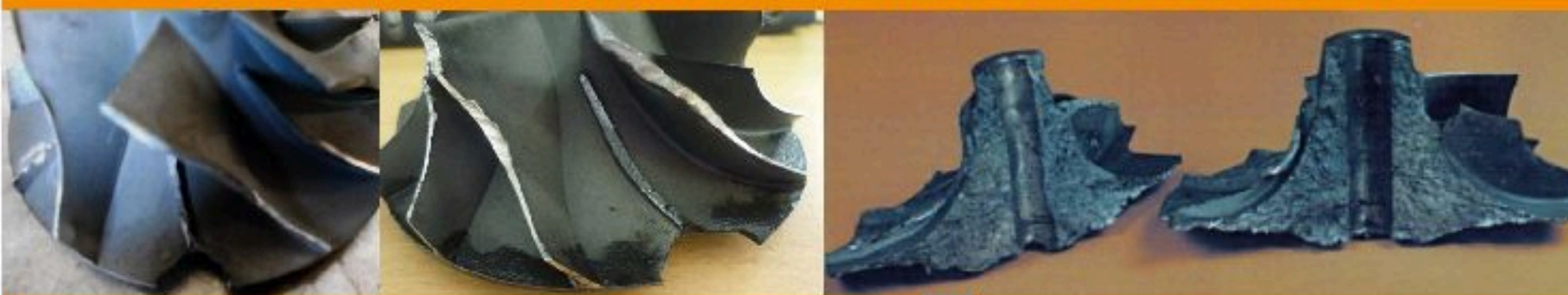
Broken Compressor Wheel / Quiebra Anormal de La Rueda Compresora