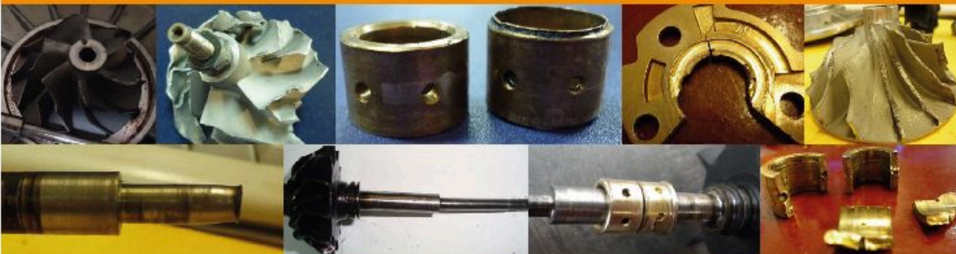
Surge or Shaft Motion Operation / Operación Irregular Debido a la Aplicación