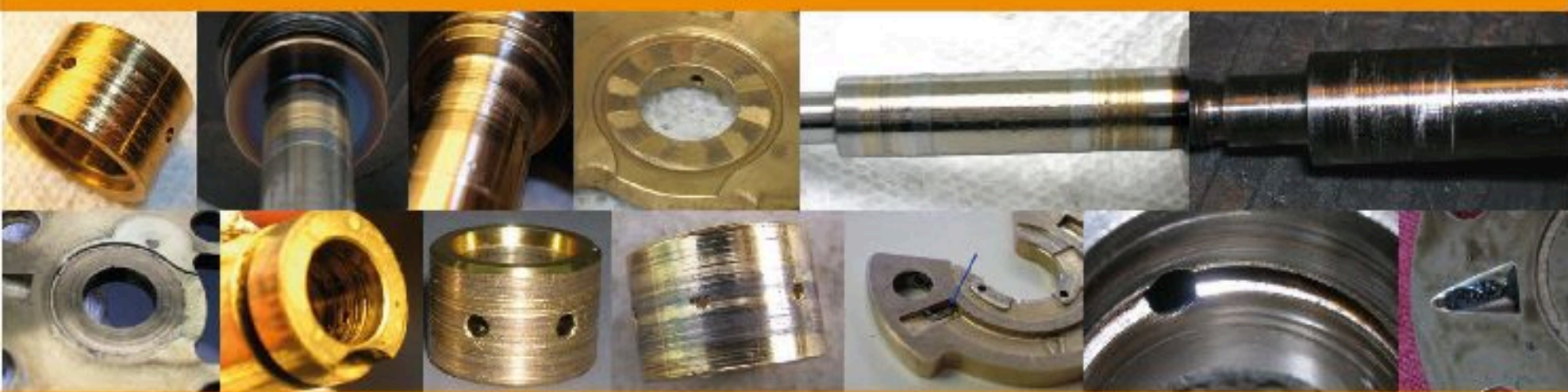
Contaminated Oil / Aceite Contaminado