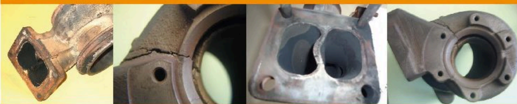
Excessive Exhaust Gas Temperature / Excesiva Temperatura de Los Gases De Escape