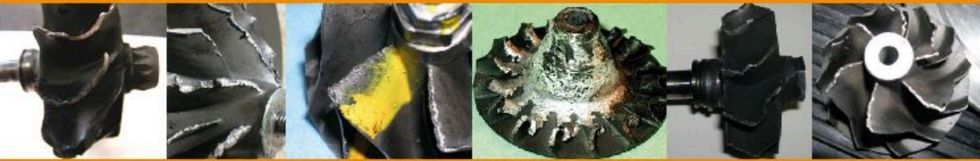
Foreign Body Ingestion / Ingestión de Objeto Extraño